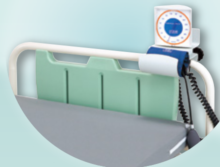
取付例(壁掛型+ベッド取付金具)