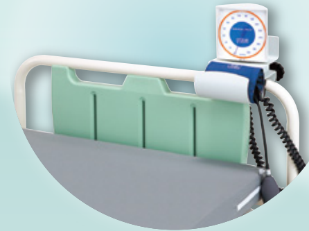
取付例(壁掛型+ベッド取付金具)