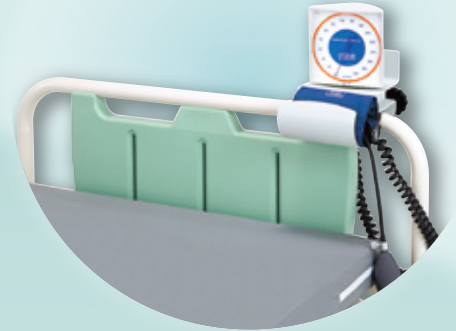
取付例(壁掛型+ベッド取付金具)