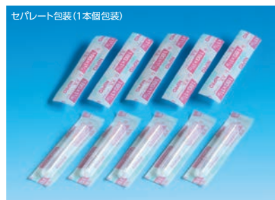
セパレート包装(1本個包装)