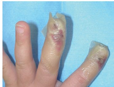
デュオアクティブ®ET貼付直後