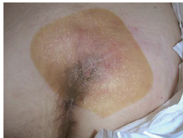
デュオアクティブ®ET貼付直後