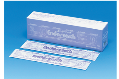
※エチレンオキサイドガス滅菌済み

本器具は、子宮体部細胞診断に必要な内膜細胞の採取が安全、迅速、かつ確実にいけるといふ利点があり、更に採取細胞の鮮度を落とさず、豊富に塗抹標本の作成も容易であるなどの特長を兼ね備えており、子宮体癌早期診断に適切な器具であります。また、もう一つ大きな特長としてループ部に付着した内膜片による組織診断も可能です。