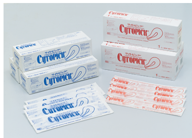
※エチレンオキサイドガス滅菌済み

従来法による一次スクリーニングで偽陽性とされ最終診断が確定している例について、綿棒法及び本法により細胞を採取、細胞診を実施して最終診断を比較したところ、綿棒法による正診率52.5%に対しサイトピック法では81.4%でした。すなわち本法は綿棒法に比し一次スクリーニング後の診断精度を約30%向上させることが判明しました。