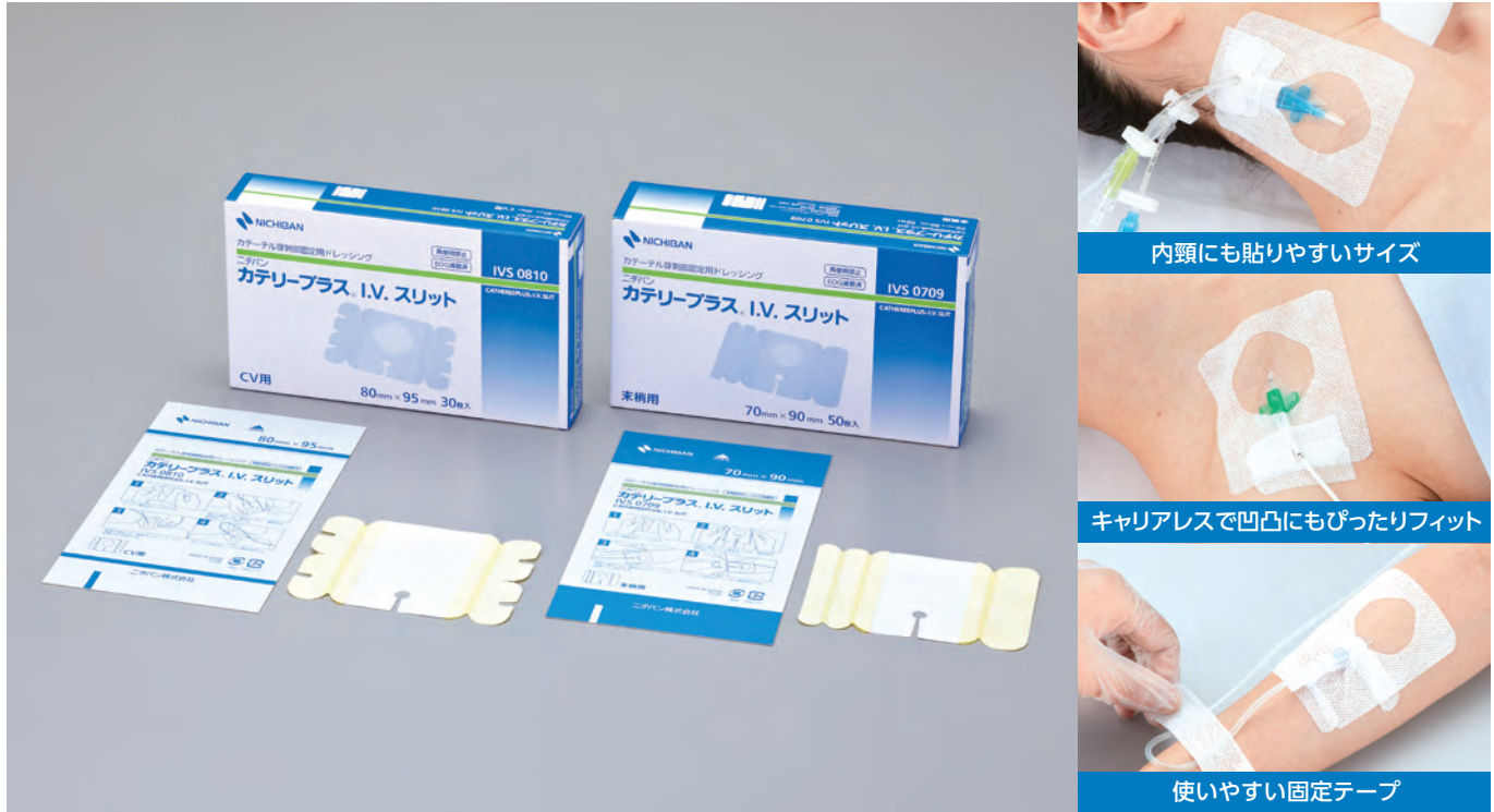
内頸にも貼りやすいサイズ