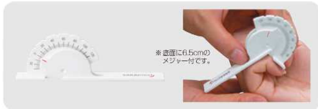
* 直面に6.5cmのメジャー付です。