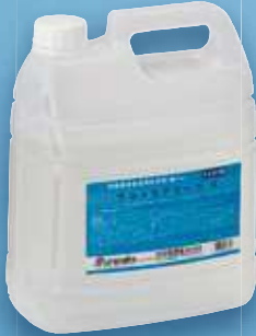
ウルトラアラーウ S