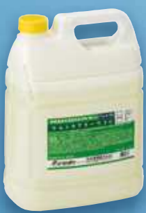
ウルトラアラーウ 20