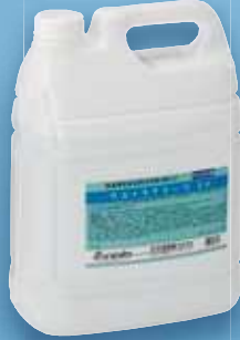
ウルトラアラーウ 30