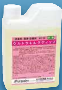
ウルトラミルクディップ