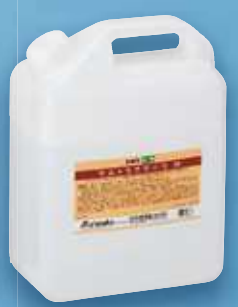
ウルトラアラーウ M