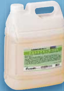
ウルトラアラーウ 700