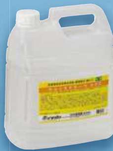
ウルトラアラーウ 800