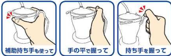
補助持ち手も使って

・フタを回して位置を変えられる補助持ち手が付いているため、手の大きさに合わせて使うことができます。 ・握力の弱い方や、やむを得ず利き手で握れない方でも持ちやすい仕様です。 ・2段階持ち手は、握りやすい滑り止め付きです。