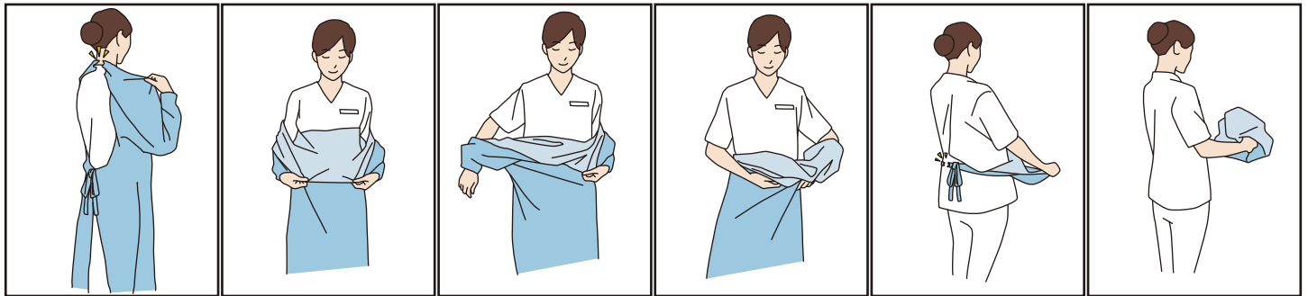
①首の部分を持って前へ引き、首ひもを切る ②表面が内側になるように、上半分を折る ③裏返すように腕を引き抜く ④反対の腕も同様に引き抜く ⑤裾の部分から表面が内側になるようにまとめ、前に引き腰ひもを切る ⑥所定の場所にすぐに破棄する