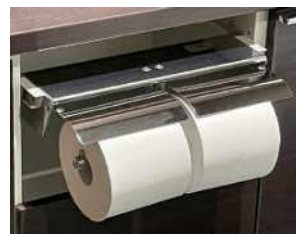
使用イメージ(ホルダー別途)