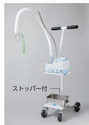
架台 ¥32,000 税別

※エラー表示が点灯すると振動子の動作は停止しますが、電源ランプは点灯したまま送風ファンは動作しております。