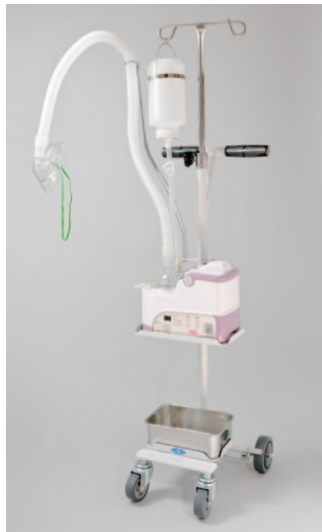
本体・薬液連続瓶・蛇管・マスクは別売