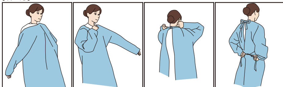
①ガウンを広げ片方の腕を通す ②もう片方の腕も通す ③首ひもを結ぶ ④全体を整えて腰ひもを結ぶ