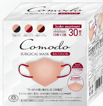
3カラーアソートボックス