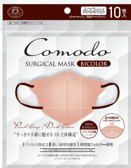
ピーチベージュ×耳紐ダークブラウン