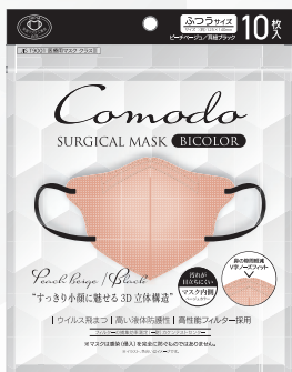
ピーチベージュ×耳紐ブラック