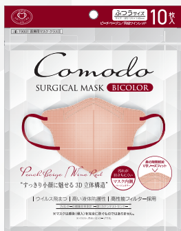
ピーチベージュ×耳紐ワインレッド