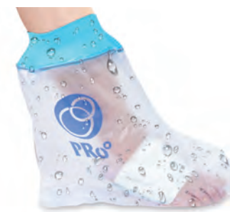
② 大人用 アシ 36cm