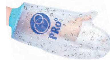
⑪ 大人用 ウデ 38cm