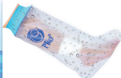
⑤ 子供用 アシ 50cm