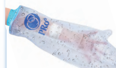
⑮ 子供用 ウデ 49cm