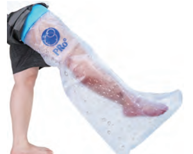
④ 大人用 アシ 78cm