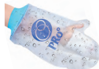
⑭ 子供用 ウデ 34cm