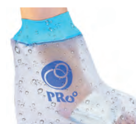
⑯ 子供用 アシ 32cm