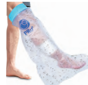
③ 大人用 アシ 66cm