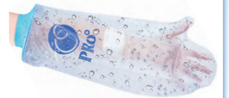
⑫ 大人用 ウデ 57cm