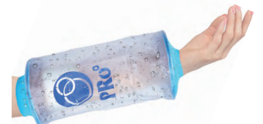
⑬ 共用 ウデ 30cm