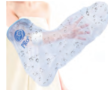
① 大人用 ウデ 63cm