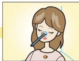
麻酔薬を塗布した 鼻腔拡張チューブを挿入