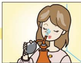
局所血管収縮剤をスプレー